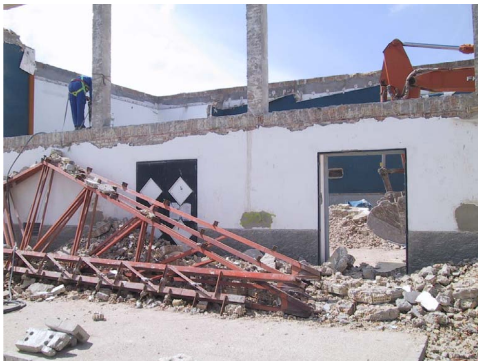
Trabajos de derribo del antiguo cine y salón de actos. 2003.

La población de Guadalcaçín continúa creciendo y con casi seis mil habitantes, un potente tejido asociativo y un programa anual estable de actuaciones socioculturales y festivas, demandaba que este espacio cultural se adecuara a las nuevas realidades sociales.