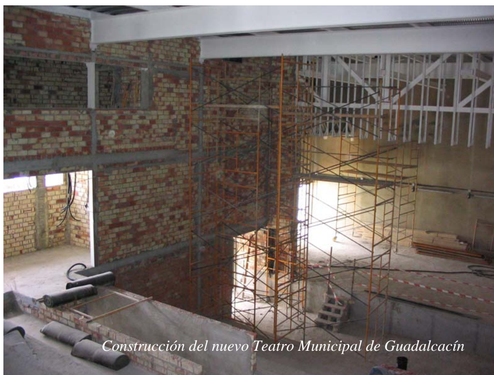
Construcción del nuevo Teatro Municipal de Guadalcaçín