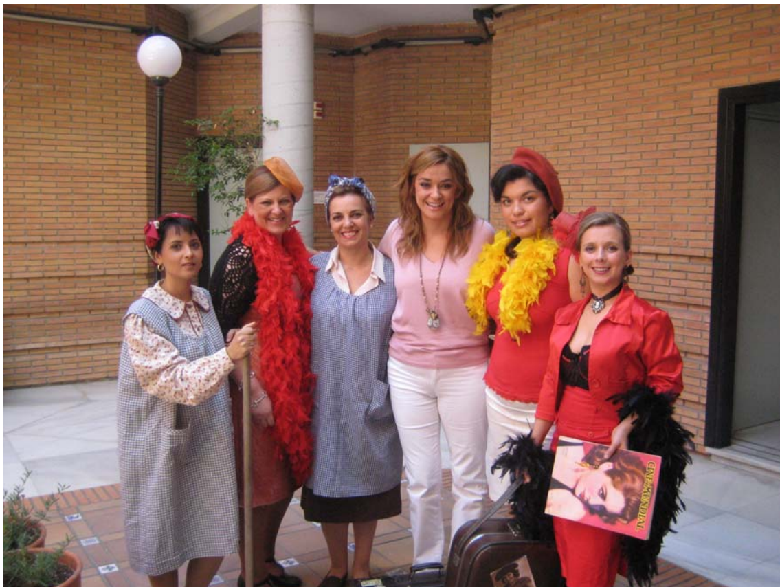
Actrices de Las Salvajes en Canal Sur Televisión.