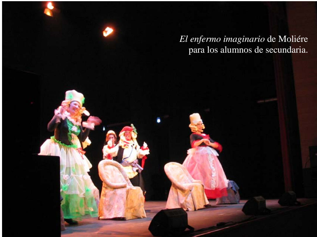
El enfermo imaginario de Molière para los alumnos de secundaria.

Los principales criterios de programación de actividades escénicas en Guadalcacín tiene muy en cuenta diferentes factores de gestión técnica y profesional y diferentes factores que primen las decisiones de diseño de la oferta teatral. En este sentido, se pretende también estimar la relación existente entre la selección de estos criterios artísticos y técnicos con la aplicación de principios y técnicas de gestión comercial.