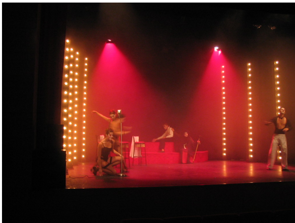
Don Juan, en formato de musical por Viento Sur Teatro. 2006.

Podemos señalar que las líneas maestras de la programación del Teatro Municipal de Guadalcazín son las propias de las sala de formato mediano o salas alternativas de grandes ciudades próximas como Sevilla o Cádiz. Podíamos compararla con La Imperdible, La Fundición, Sala Cero o El Cachorro de la capital hispalense o la Sala Central Lechera de Cádiz.