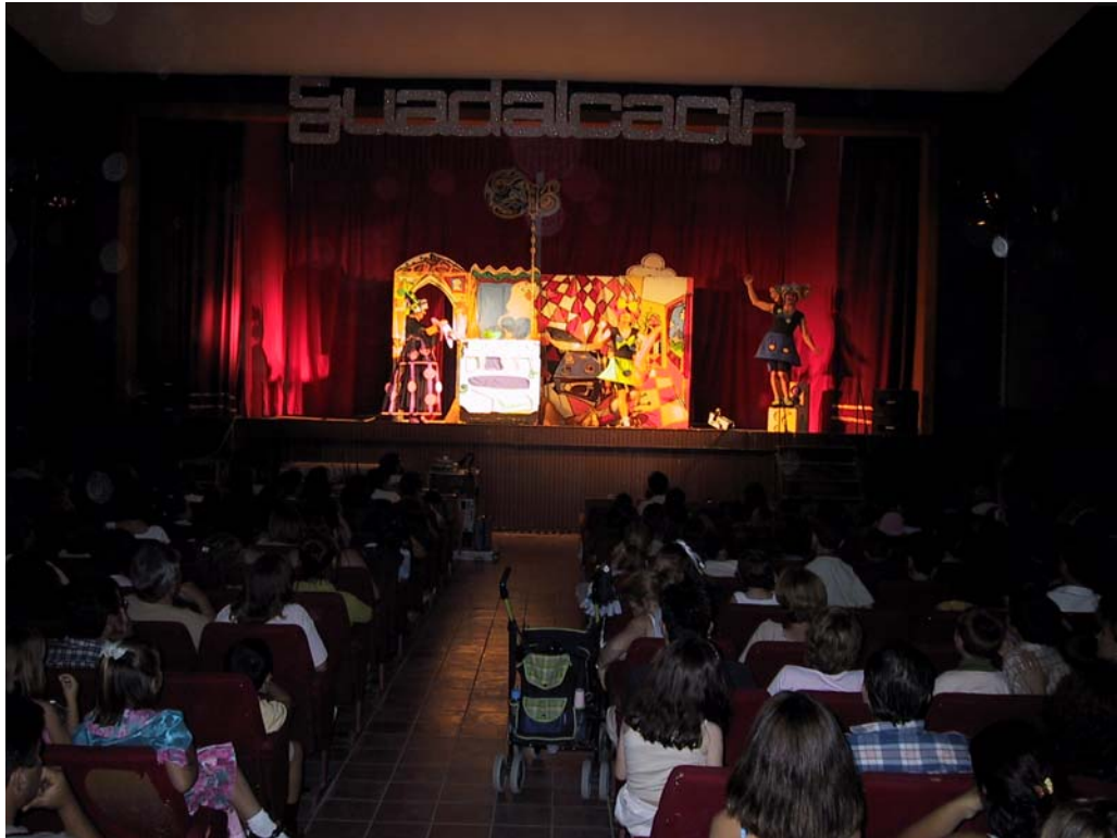
Una de las últimas representaciones de teatro en el antiguo cine antes de su derribo para convertirse en el nuevo Teatro Municipal de Guadalcacín.

El edificio estaba dentro de la línea del tardío racionalismo que caracteriza el urbanismo de estas poblaciones de colonización y la arquitectura de sus construcciones. De dos plantas, estaba definido principalmente por un patio de butacas de aceptables condiciones espaciales, un escenario de reducidas proporciones sobre todo en cuanto a fondo (por el destino principalmente cinematográfico del edificio), y después una serie de espacios como el hall de entrada, camerinos, bar, servicios, cabina de proyección y rebobinado, almacén y salas de uso social.